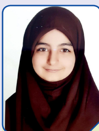
پریسایغی دبیرستان ۱۹