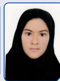
محدثه مسعود دبیرستان ۱۹،۶۱