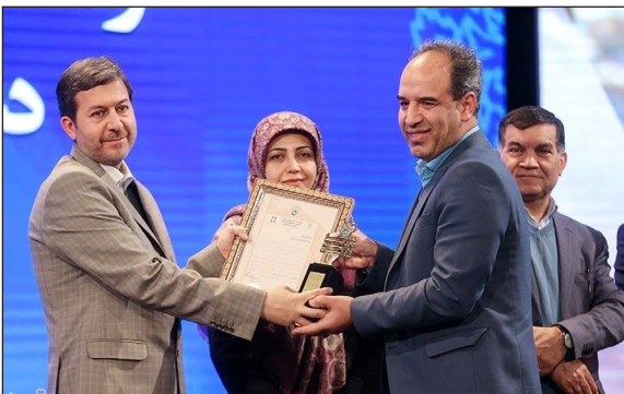
شهری و روستایی است.

اکنون که به واسطه تلاش سازنده جناب عالی و همکاران در حوزه پژوهش و آموزش مدیریت شهری و روستایی و بنا به نظر کمیته داوران جشنواره پژوهش، آموزش و نوآوری در مدیریت شهری و روستایی مشترک بین مرکز مطالعات برنامه ریزی شهری و روستایی سازمان شهرداریها و دهیاریهای کشور و مرکز مطالعات و برنامه ریزی شهر تهران، استانداری یزد به عنوان استانداری برتر در حوزه پژوهش و آموزش مدیریت شهری و روستایی شناخته شده است، ضمن قدردانی و سپاسگزاری از مشارکت اثر بخش شما در این جشنواره، بهروزی و توفیق روز افزونتان را از درگاه ایزد منان مسئلت دارم.