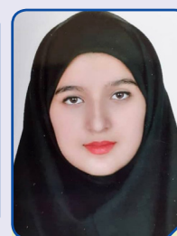
ساحل معتمدراد دبیرستان ۱۹،۲۶