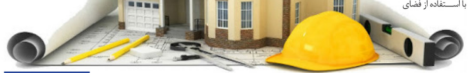
یادداشت مدیر مسئول

رغم این که تغییر رفتار مردم در خصوص ساخت‌وسازهای غیرمجاز روندی زمانبر است، در سال‌های آتی شاهد بهبود این فضا در استان باشیم.